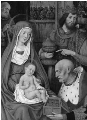
Épiphanie : Manifestation du Fils de Dieu au monde. Des mages venus d'Orient arrivèrent à Jérusalem... Matthieu 2, 1

Les présents : l'or célébrait la royauté, l'encens la divinité et la myrrhe annonçait la souffrance rédemptrice.